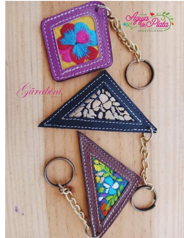
Figura 7 Llaveros con bordado de San Antonino Castillo Velasco, Oaxaca, México

La innovación representa una herramienta de crecimiento y desarrollo para las empresas artesanas, repercute en su rentabilidad mediante el incremento de sus ventas, no solamente con la diversificación de producto, sino también, en la implementación de nuevos y mejorados procesos de comercialización o bien en el uso de diversos y novedosos medios de venta tanto digitales como de manera físicos.