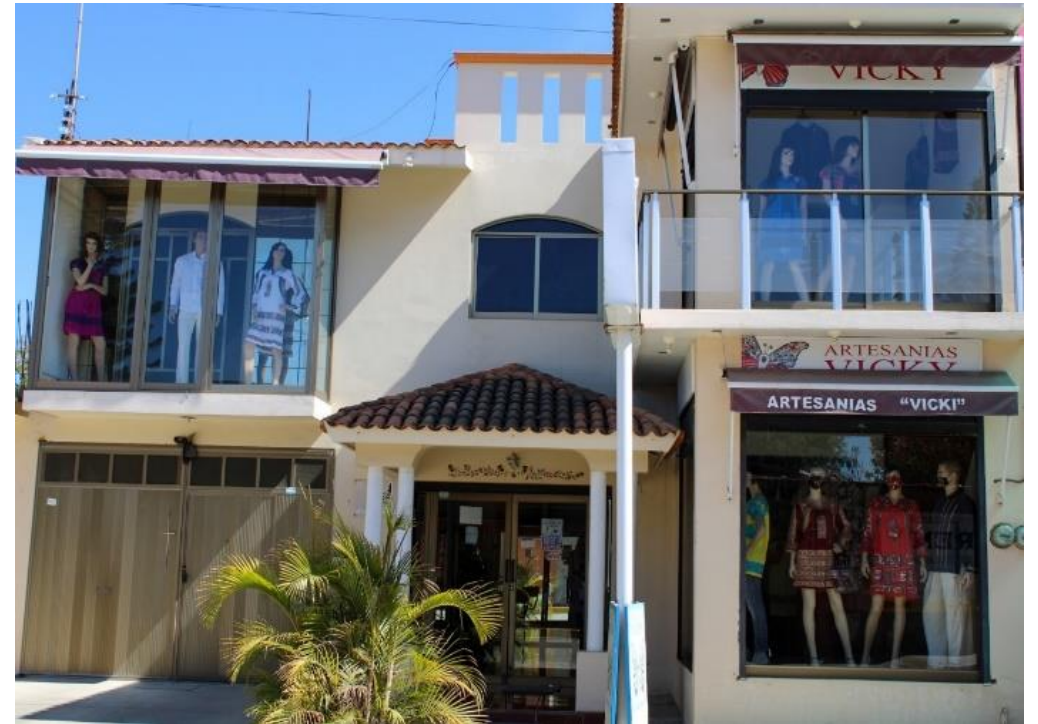
Figura 4 Artesanías "Vicky"

De acuerdo al Directorio Estadístico Nacional de Unidades Económicas 2019 del INEGI, se identificaron 452 establecimientos comerciales en San Antonino Castillo Velasco con 106 actividades económicas diferentes, de las cuales quince son dedicadas a la actividad de confección, bordado y deshilado de productos textiles representando el 3.31 % del total (HACSACV, 2022).