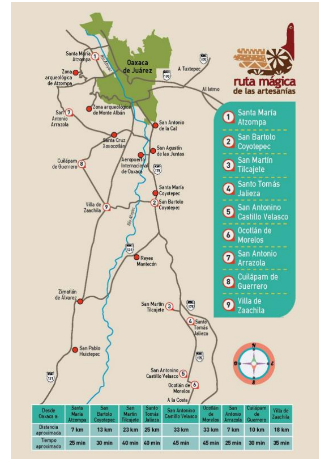
Figura 3 Ruta Mágica de las Artesanías, Oaxaca, México.

Oaxaca es un estado reconocido por su cultura y biodiversidad, en múltiples municipios las personas elaboran productos a base de diferentes materias primas como barro, madera, hilo, flores entre muchos otros, creando mágicos productos conocidos como artesanías.